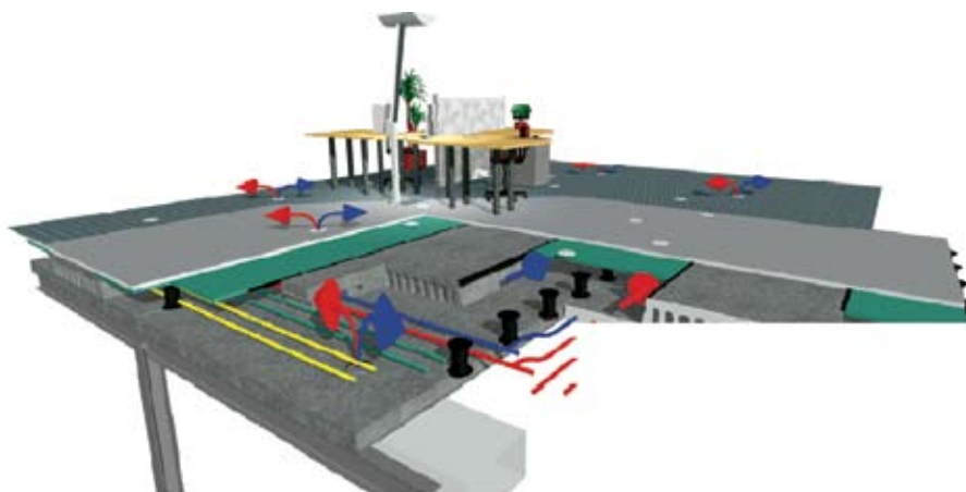
Figuur 3: Wingvloer-systeem met geïntegreerde kanalen voor warmte en koude doeleinden.

Sinds een aantal jaren worden nieuwe methoden en strategieën ontwikkeld om zowel op bouwmaterialen als op energiegebruik te besparen. Door alle specialisaties vanaf het begin in het ontwerp van het gebouw te betrekken, kan een veel betere totale optimalisatie bereikt worden. De grenzen tussen het constructieve deel van het gebouw en de technische installatie vervagen, zoals het voorbeeld van de wingvloer aantoont. Een verfijnd architectonisch ontwerp kan de warmte en koude behoefte verminderen. Tevens kunnen verwarming en koelfaciliteiten in de constructie geïntegreerd worden. Op deze manier kan een perfect binnenklimaat met extreem lage energieconsumptie gecombineerd worden.